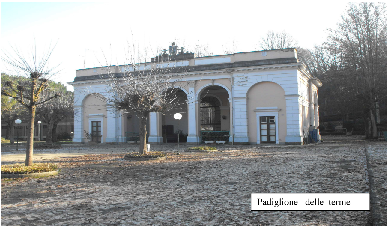
Padiglione delle terme

Un discorso a parte merita il tema della rigenerazione del sistema termale . Questo segmento è senza dubbio quello che riveste la maggiore complessità ma anche il maggior fattore di crescita potenziale. Il segmento del wellness è un segmento, che nonostante la congiuntura economica, non mostra cenni di cedimento, anzi. L'idea a Brisighella è di creare per un potenziale investitore un mix attraente tra struttura termale, strutture a servizio (benessere, parco e piscine termali, beauty farm) e parte commerciale che non entri in competizione con il commercio consolidato di vicinato. È del tutto evidente come questa azione necessiterà di tempi più lunghi e, per strutturarsi in modo sufficientemente solido, di un conteso rigenerato dal complesso delle azioni. Un errore enorme da non correre è di considerare il territorio alla stregua di una risorsa per la riproduzione del capitale ed una vetrina per la competizione immobiliare "la pianificazione urbana è vissuta sempre più di frequente come strumento di marketing urbano, che in realtà è marketing immobiliare" . La comunità non potrebbe riconoscersi in una politica con queste connotazioni. Per evitare ciò è necessario inserire azioni mirate all'interno di un quadro complessivo di sistema.